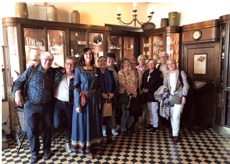
Juuni alguses külastasid Tallinnat Soome seniorapteekrite ühenduse liikmed. Tallinna Raeapteegis meenutati ürdisoola valmistamise töötoas praktilisi apteekrioskusi. Huviga kuulati meie apteegi uudiseid ja räägiti ka apteegiuuendustest Soomes.