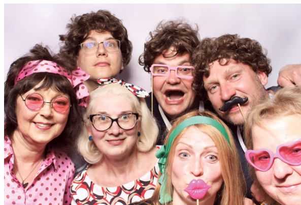
60. Suveseminaari korraldusmeeskond

NB! Ootame uusi kolleege liituma Eesti Farmaatsia Seltsiga, et veelgi enam suurendada farmaatsiavaldkonna ühtekuuluvustunnet ning ühes koos edendada seltsi tegevust. EFS-i põhikirja ja liikmeks astumise kohta saate infot kodulehelt www.efs.ee .